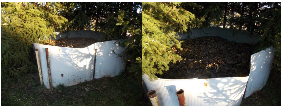
Obr. 10., 11. - Náš kompost