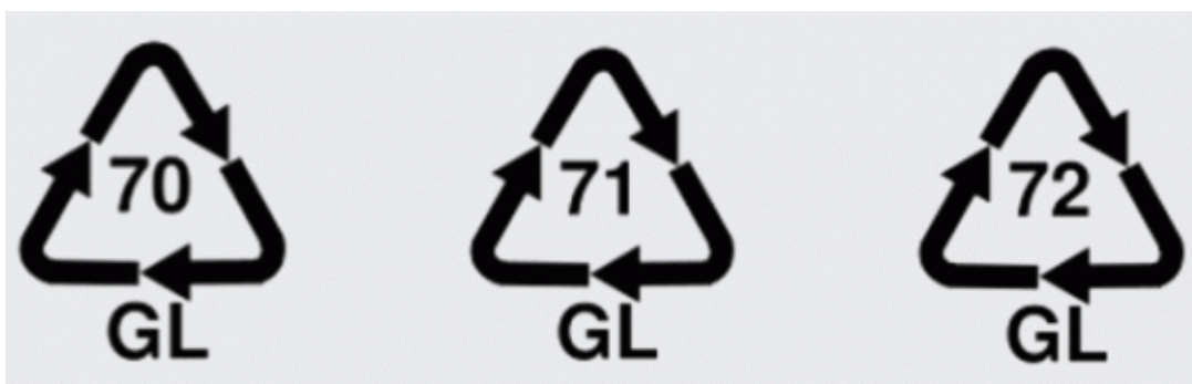
Obr. 20. – Označenie skla