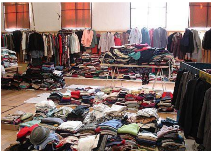
Obr. 22. – Zber oblečenia