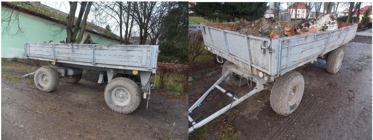
Obr. 14. – Obecná vlečka, Sása

konáre, kvetiny alebo iný zelený odpad . Počas letných mesiacov sa vlečka naplnila aj počas jedného dňa, čo znamená že množstvo tohto odpadu bolo enormné. Problémom je, že vo vlečke sa mnohokrát vyskytol aj iný odpad, čím sa biologicky rozložiteľný odpad znehodnotil. Kvôli týmto problémom sa obecné zastupiteľstvo rozhodlo zakročiť, a tak sa táto obecná vlečka ruší a to od 1.1.2017. Obec ale ponúka niekoľko možností. Občan má vlastný kompost, a obec s ním urobí dohodu o nakladaní s uvedením odpadom. Obec zabezpečí nádoby na tento odpad, a celkový poplatok za odpady sa zvýši o 6€. Ďalšou alternatívou sú kompostéry, ktoré obec zabezpečí do domácností a zabezpečí na ne určitú dotáciu.