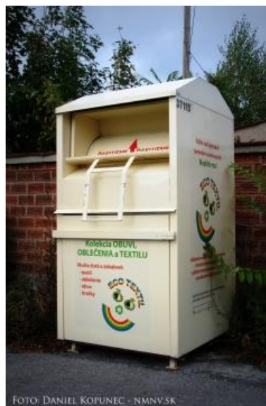
Obr. 23. – Kontajner na oblečenie