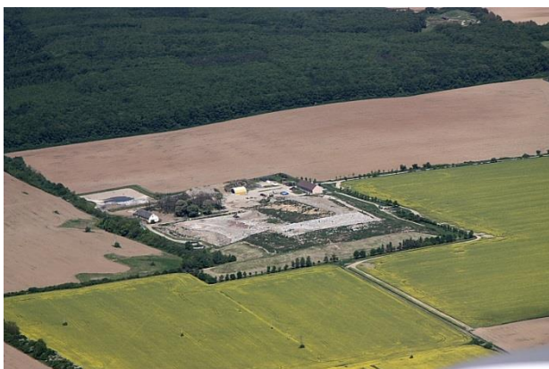
Obr. 3. – Skládka odpadov Nový Tekov (nebezpečný dopad)

Každý rok sa za zber odpadu platia poplatky, ktoré platí povinne každá domácnosť, v závislosti od počtu osôb (10€/os./rok). V tomto poplatku je zahrnutý zber komunálneho odpadu, triedeného odpadu a nebezpečného odpadu.