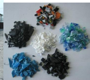
Obr. 9. – Drvína