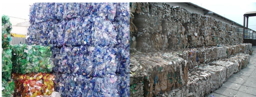
Obr. 7. – Zlisované PET fľaše

Odpad je upravený tak, aby bolo zabezpečené maximálne vytázenie prepravných prostriedkov. Následne je expedovaný priamo k jednotlivým spracovateľom. Výsledným produktom je vysoko kvalitná drvína, ktorá sa opätovne využíva vo výrobnom procese .