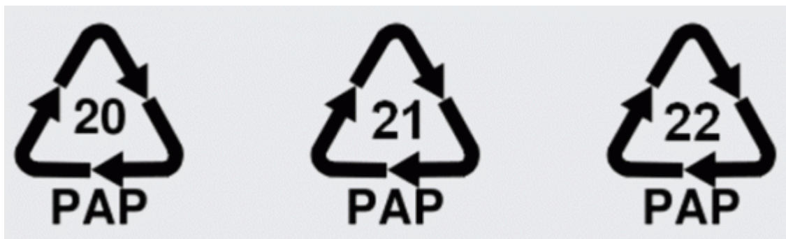
Obr. 16. – Označenie papiera