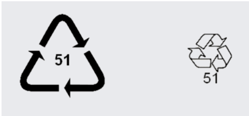
Obr. 18. – Označenie dreva