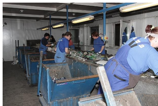
Obr. 6. – Dotriedovanie odpadov zo separovaného zberu

Odpad je upravený tak, aby bolo zabezpečené maximálne vytázenie prepravných prostriedkov. Následne je expedovaný priamo k jednotlivým spracovateľom. Výsledným produktom je vysoko kvalitná drvína, ktorá sa opätovne využíva vo výrobnom procese .