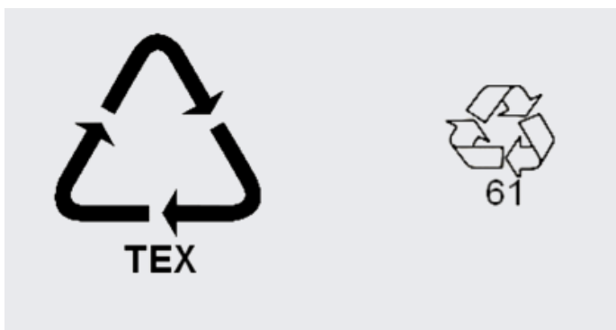
Obr. 19. – Označenie textilu