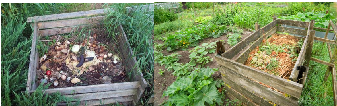
Obr. 12., 13. – Príklady domáceho kompostu

Vytvoriť domáce kompostovisko je dobré v jeseni. Budete mať dostatok materiálov na jeho podklad. Na začiatok vám stačí zhrabať opadané lístie, ktoré poslúži ako základ. Pripravenú kopy si prikryte alebo zasypte troškou hliny, aby vám ju vietor nerozsfúkal. Ak máte pozbierané lístie, tak začnite zo zazimovaním iných rastlín a vlastne aj celej záhrady. Takto veľmi jednoducho získate zvyšky či odrezky kvetov, buriny, zeleniny, zahnitého ovocia či šupiek, ktoré sa hodia do kompostoviska. Všetko čo ste nahromadili môžete premiešať s nahromadenými listami a k tomu všetkému môže pridať aj slamu či menšie konáriky. Aby bolo kompostovisko správne vyvážené, tak by ste mali striedať vrstvy mäkkých materiálov s tvrdými a suché s čerstvými zostatkami (ideálne sú zvyšky z kuchyne). Vody by nemalo byť veľa, aby nevytláčala z hmoty vzduch. Kompost z rozličného materiálu je kvalitatívne lepší ako len z pokosenej trávy a lístia. Počas roka do kompostu pridávajte bioodpad a po 6 až 12 mesiacoch je kompost dozretý.