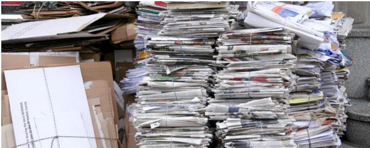
Obr. 21. – Zber papiera

Noviny, časopisy, kancelárske papiere a iné papierové odpady, ktoré naša domácnosť vyprodukuje, zbierame. Každý mesiac do našej obce prídu vyberať papier, za ktorý nám podľa váhy dajú toaletný papier, hygienické vreckovky, kuchynské utierky alebo iný tovar z papiera. Hrubšie kartóny z krabíc používame na zakurovanie. Niektoré pevné škatule používame na uskladňovanie orechov, poprípade iných vecí, ktoré skladujeme v pivnici.