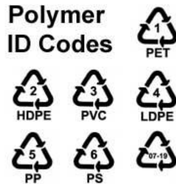
Obr. 15. – Označenie plastov