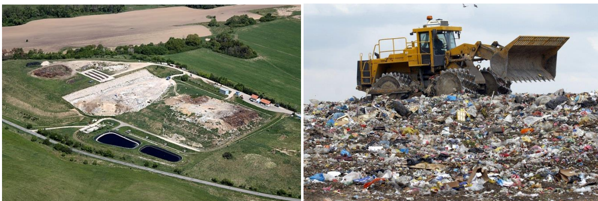
Obr. 1.,2. – Skládka odpadov Zvolenská slatina (Spoločnosť Pohronie, a.s.)

Takmer každá obec zabezpečuje zber odpadu. Taktiež aj naša obec, ktorá spolupracuje so spoločnosťou Marius Pedersen, a.s. Hlavnými oblasťami, v ktorých sa spoločnosť úspešne presadila sú zber, preprava, zhodnocovanie a zneškodňovanie odpadov, vrátane triedenia, lisovania a recyklácie druhotných surovín, ďalej v oblastiach prevádzkovania skládok odpadov, zhodnocovania biologických odpadov kompostovaním a zabezpečovania bežnej, zimnej údržby komunikácií a starostlivosti o verejnú zeleň. Prevádzkuje tiež dvanásť skládok odpadov (z toho tri skládky aj na nebezpečné odpady) a päť dotriedňovacích stredísk.