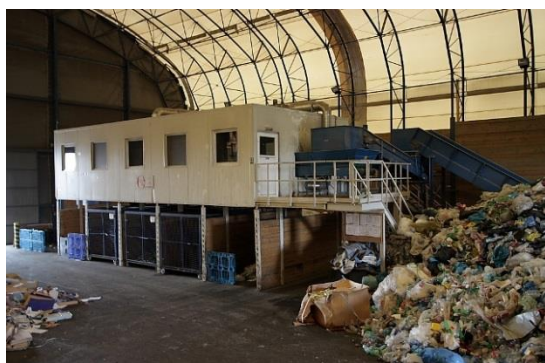
Obr. 5. – Triediaca linka

Druhotné suroviny sú v zariadeniach triedené na triediacich linkách a spracovávané v lisovacích zariadeniach, hlavne v kontinuálnych kanálových lisoch a expedované do recyklačných zariadení ako sú papierne, sklárne a k spracovateľom plastov.