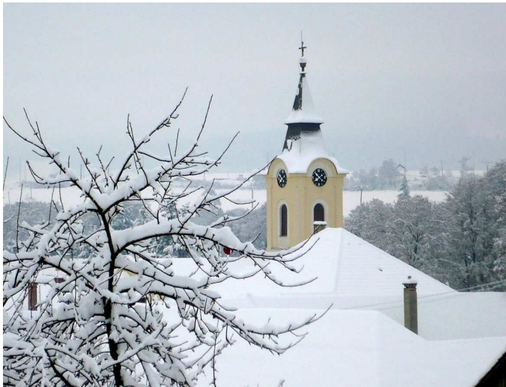
Evanjelický kostol v Sásе. Foto: JUDr. Peter Nemeč (2017)

...informácie o živote a dianí v obci Sása