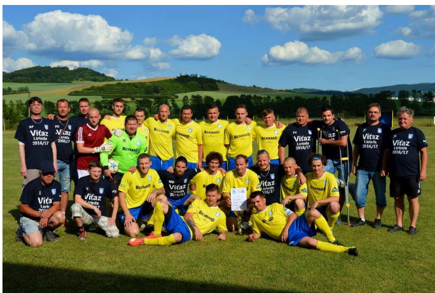
Členovia OŠK Sása. Foto: Mgr. Jana ČÚTTOVÁ (2017)

Naši futbalisti víťazstvom v I. triede postúpili po 28. rokoch do krajskej futbalovej súťaže 5. ligy, skupiny C, kde v úvodnom zápase na ihrisku FK FILJO Lodomerská Vieska podľahli súperovi v pomere 5:2. Následne účasťou v krajskej súťaži náš klub dostal možnosť predstaviť sa v 2. kole Slovenského futbalového pohára s názvom SLOVNAFT CUP, kde na ihrisku TJ Štiavnické Bane rovnako podľahol domácim v pomere 6:2. Lepšie sa naše mužstvo prezentovalo v 2. kole 5. ligy, skupiny C, keď privítalo na domácom ihrisku OFK 1950 Priečhod a vyhralo v nervóznom zápase v pomere 4:2.