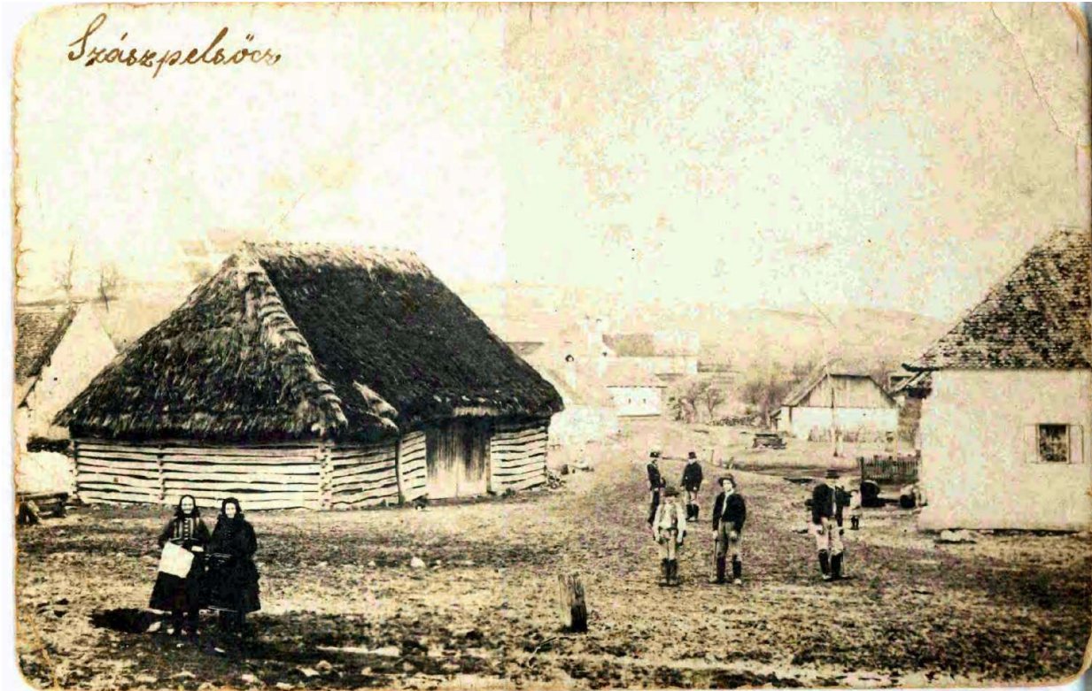
Sása na začiatku 20. storočia.

...informácie o živote a dianí v obci Sása